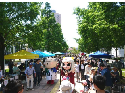
アクト通り歩道の街路樹 (メタセコイヤ)の緑の中で開催

これからの課題として、協力スタッフの参加募集、資金調達の方法、地域住民や近隣組織との連携の充実等が挙げられますが、開催を継続し解決策など検討しながら課題の解決を目指しています。