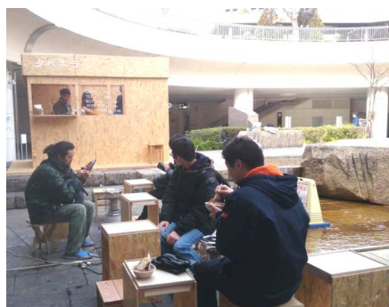
学生によるカフェ