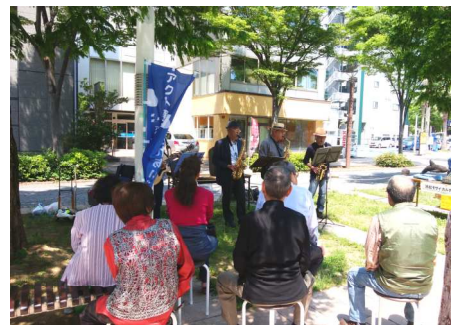
地域のお仲間「トキバン」の サクセス生演奏♪

平成30年度 アクト通りふれあいデイ開催日 〈毎月第3日曜日〉 9時～12時 ※雨天中止 平成30年 4/15、5/20、6/17、 7/15、8/19、9/16、 10/21、11/18、12/16、 平成31年 1/20、2/17、3/17