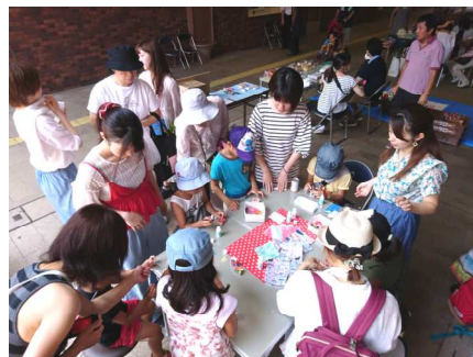
文芸大学生によるワークショップ。 夏季は涼を求めて地下道でも開催