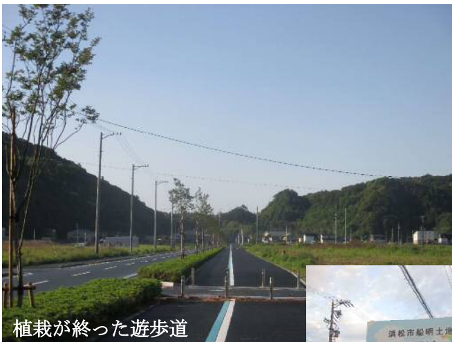
植栽が終った遊歩道