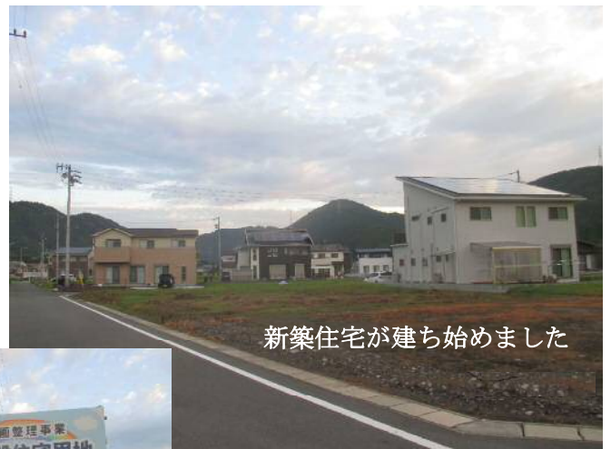
新築住宅が建ち始めました