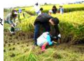
【協議会と稲刈体験の様子】