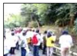
説明を聞く参加者