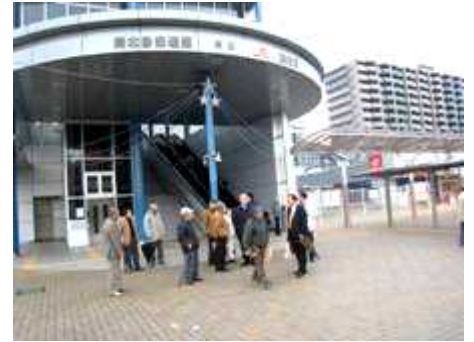
【12/13 藤枝駅周辺視察研修の様子】

12月13日、平成14年度に完了した藤枝駅南の区画整理地区を訪れ、新しく整備された駅前広場やその周りの土地利用状況、雨水調整池を併設した公園などを視察研修しました。