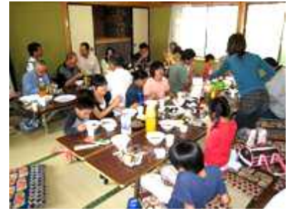
【10/7 みんなで作ったお料理を食べながらにぎやかに収穫祭】

これからも基盤整備や地域コミュニティの活性化など、住民のご意見を聞きながら、住民のまちへの想いをまとめていきたいと思っています。