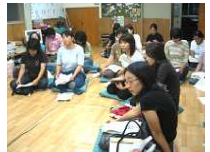
【地区計画 説明会の様子】

地区の住環境を守っていくために、協議会を設立して整備計画を検討してきました。地区計画の素案づくりは今大詰めに差し掛かり、自治会や子供会など地域住民を対象にした説明会を開催中。建物の用途や高さ・形や色、境界からの距離、塀や柵などが制限されるようになります。「家の前に高いマンションが建つと困るから、賛成」とか「外壁の色は自由でいいのでは」と色々な意見が出されます。自分達のまちの将来像を、皆で真剣に考えています。