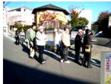
【11/25 のまち歩きの様子とまとめ】

私たちは、住環境・生活環境の保全や向上を目指した地区計画づくりや浜松市長公舎の有効利活用、地域コミュニティの活性化のため、毎月1回(第2土曜日)に広沢公民館に皆で集まって勉強会を開き取り組んでいます。