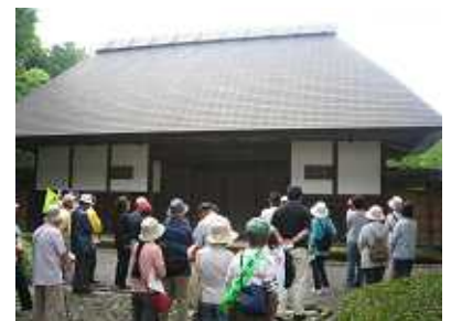
【まち歩き 高林家長屋門】

ワークショップ「まちの良いところ・悪いところ」でまちの特徴や課題を整理し、世代間の交流を図りながら今まで以上に元気で、仲の良いまちを目指しています。