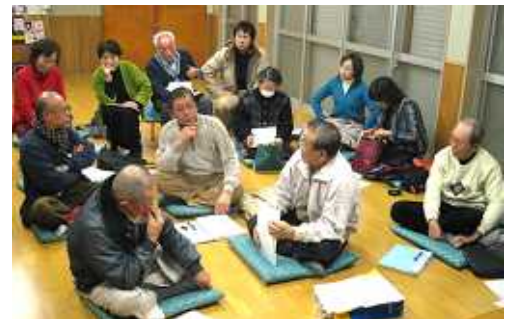
協議会での話しあい