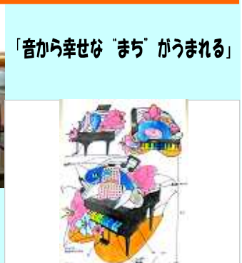
「音から幸せな“まち”がうまれる」