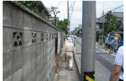
歩道に面して作られたブロック塀