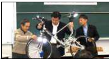
折りたたみ自転車を紹介。

その後「ノーカーデーはままつ」の紹介をしました。ヨーロッパでは9月にモビリティウィークが実施されており、その中心イベントとして9/22に「カーフリーデー」が行われています。この日は1日車を使わない地区を創り出し、車のない都市空間を体験します。これに習い浜松では10/3~4の収穫祭のイベントに合わせ、「ノーカーデーはままつ」を実施する予定です。