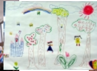
地球ボールに願いを込めて・・・