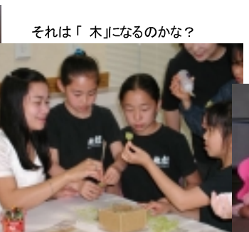
それは「木」になるのかな？