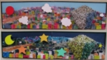
「HAMAMATSU 屋の顔 夜の顔」(制作・笹田学園向陽台高校美術部生徒さん)