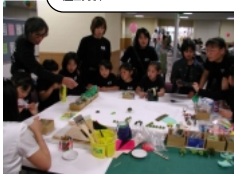
ちゃんとひとつの公園になるのでしょうか？