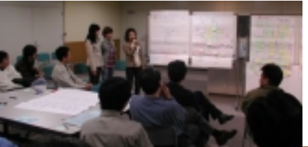
では、発表します！（キンチョーするなあ）