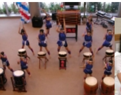
そろってるねえ。んー、力強い！（魁鼓の皆さん）