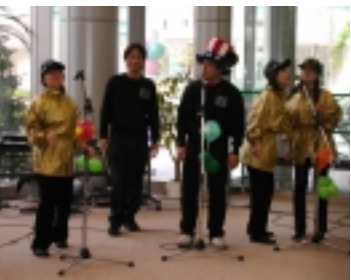
まちづくりって楽しいなあーラララララ（エキゾチッククラブのみなさん）