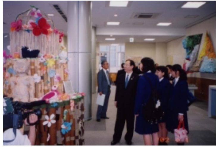
市長さんも生徒さんがつったオブジェに感心！