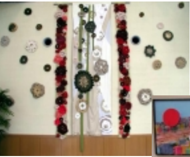
「花創都市」(制作江之島高校芸術科生徒さん)

センターは東田町の再開発ビル「ウィステリアE-on e」の1～3階の一部(延べ約2,000㎡)にあります。1階は受付とサロン、2階はシンポジウムなどを行なえるギャラリーをはじめ、まちづくり資料を集めたライブラリーやパソコンコーナー、打ち合わせ用のアトリエ、印刷機や紙折り機などがある印刷・作業室、3つの研修室など。3階は都市整備部門の事務室となっています。また、呼びかけに応じて下さった市民の皆さんから寄せられた昔の地図や街並みの写真、江之島高校・笹田学園の生徒さんによるまちづくりをテーマとしたオブジェクト作品なども展示しています。