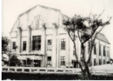
中村與資平氏設計の旧浜松市公会堂 (昭和2年竣工)