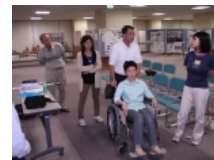
車椅子は思うように動きません。