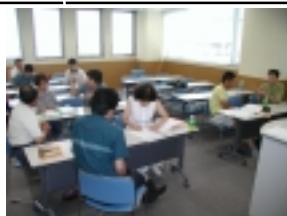
理想の家の間取りを作りました。

自分で理想の家を作りたいという方を対象に、自分でできる間取り(平面計画)、配置計画、外構計画などのコツと進め方を学びました。