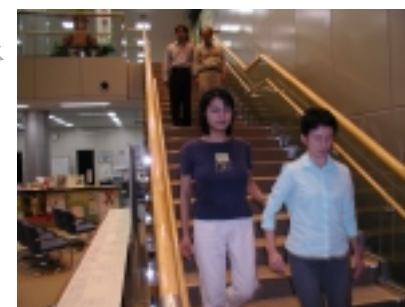
補助のコツを覚えしました