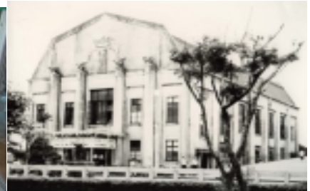
中村與資平氏設計の旧浜松市公会堂(昭和2年竣工)