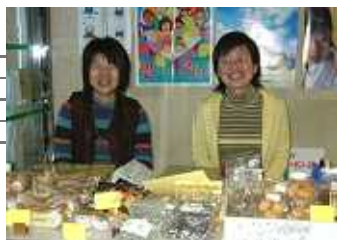
てまえみそさん 出張販売をしてくださいました。ベーグルに肉巻きおにぎり…いろいろなおいしかったです。