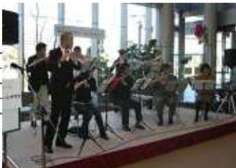
浜松フルートクラブさん 初めてみる変わった形のフルートに驚きました。アンパンマーチに子どもたちは喜んでいました。