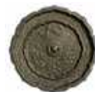
瑞花双鳥八稜鏡 浜松市天竜区水窪町出土 浜松市所蔵