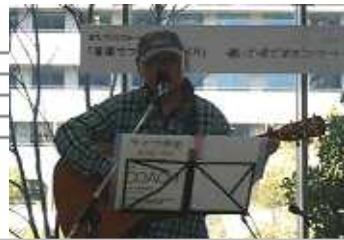
COHCH(コーチ)さん 楽しいトークと甘い声に思わず聞き入ってしまいました。