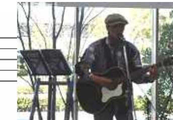
クロールさん まちはびっくり箱だぁ！！でおなじみのクロールさん。いつもながら心響く歌声でした。