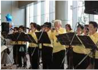
浜松中部ハーモニカ同好会さん ハーモニカの合奏は、とても爽やかで清々しい気持ちにさせてくれました。