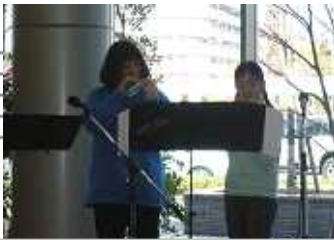
ポコ・ア・ポコさん オカリナの優しい音は、心を穏やかにしてくれて癒されました。