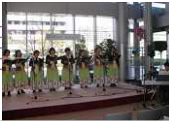
ともしびさん 「フルートアンサンブル」・「キーボード弾き語り」・「コーラス隊」の3チームで参加してくださいました。