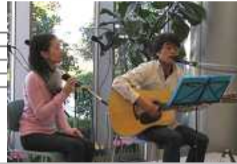
もやしさん アコースティックギターによる演奏と歌声のハーモニーはとても引き込まれました。