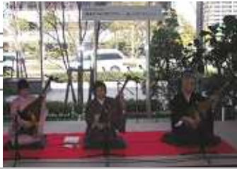
正伝士風薩摩琵琶士弦会さん 普段なかなか聞く機会のない琵琶の音色を聞くことができました。